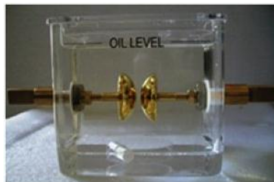
Gambar 1. Konfigurasi elektroda berdasarkan standar IEC - 60156

Gambar 1 berikut ini. Bejana pengujian dihubungkan ke tegangan tinggi dengan pengaturan kenaikan tegangan secara perlahan dan hati-hati sekitar 2kV/s sampai terjadi tembus listrik.